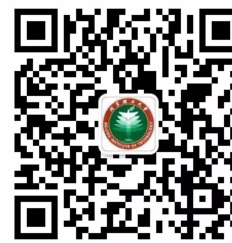
扫描二维码,关注北京理工大学官方微信