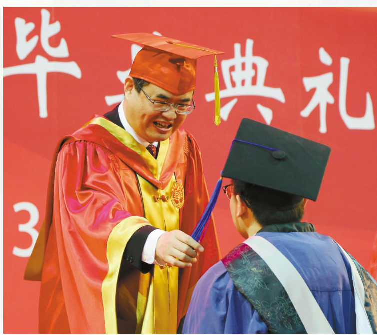
▲“军校长”给我拔穗,母校的温暖涌向心田