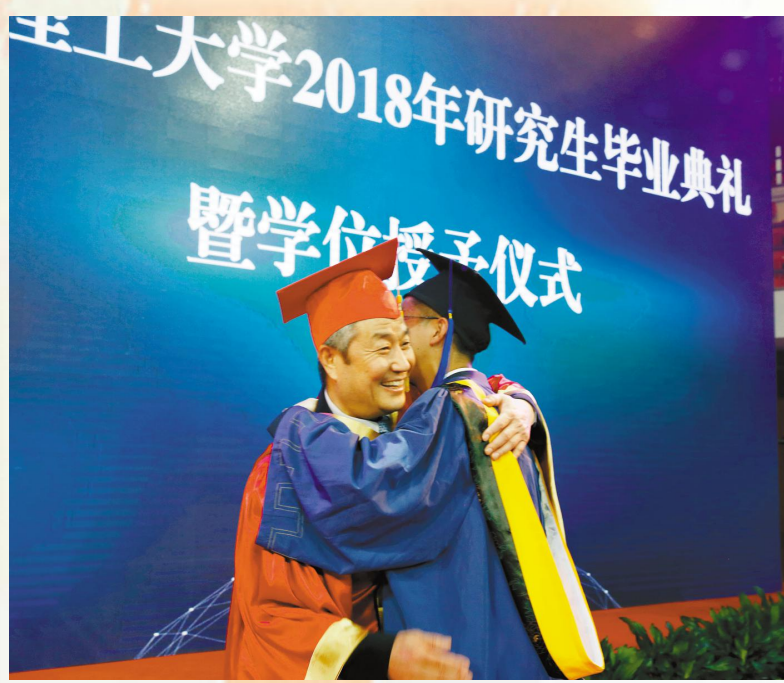
▲与长书书记来一个温馨的拥抱,母校的温暖伴着我启程

【编者按】3月18日,伴着春雪的微寒,北京理工大学2018年研究生毕业典礼暨学位授予仪式在中关村校区体育馆举行。1740名2018年春季毕业硕士研究生、博士研究生参加了毕业典礼并接受学位授予。从这里出发,我们放飞梦想;从这里出发,我们扬帆远航。带着学校、师长和同窗的衷心祝福,毕业生们踏上了新的征途!下面让我们一起来回顾毕业典礼中那些难忘的温暖瞬间吧!