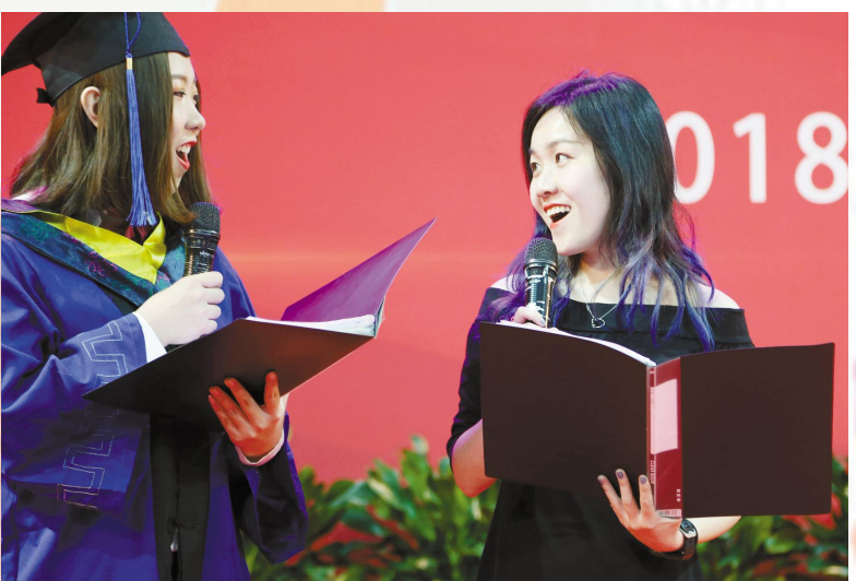
▲典礼间隙,师生深情朗诵,送上心中的祝福