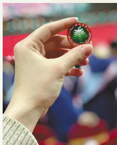
▲一朝京工人,一生京工情