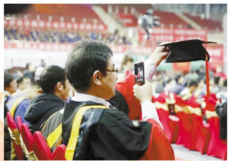
▲给学位帽拍照,记录我在北理工的学习成长