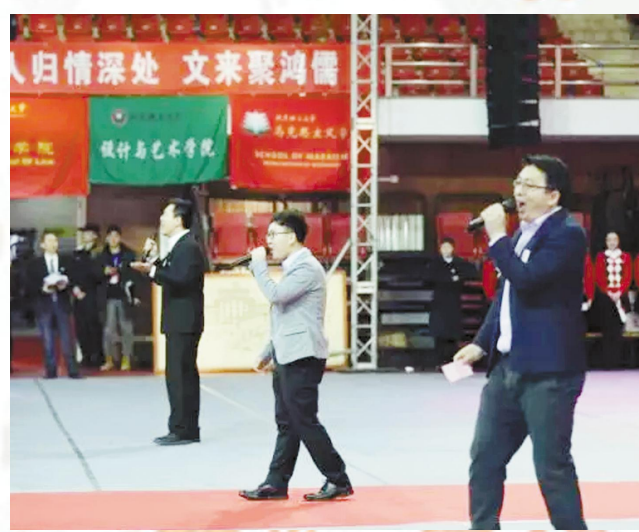
▲辅导员献唱,一曲充满祝福的青春之歌