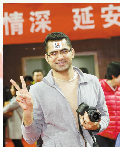
▲I love BIT! 北理工永在我心!