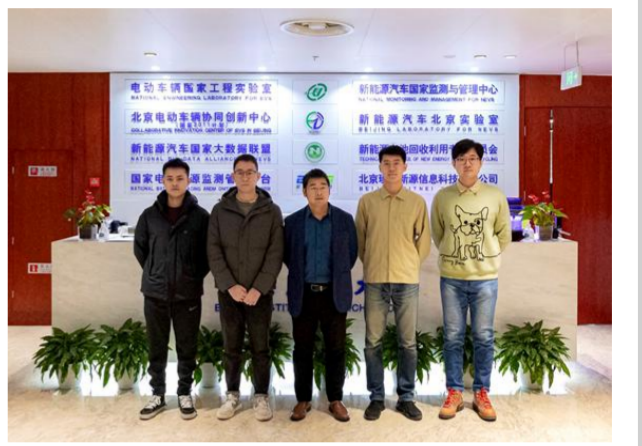
“云端电池-零碳交通的安全守卫”项目团队

北理工“云端电池-零碳交通的安全守卫”项目聚焦新能源汽车安全预警评估，利用大数据算法分析车载终端数据，实现动力电池寿命预测和安全预警，有效提升性能并降低成本。项目突破了新能源汽车动力电池系统的技术难题，实现了运行风险在线监测、联动研判、动态预警、智能控制和精准处置，营造了更安全零碳交通环境。作为我国最早从事新能源汽车研发与应用的单位之一，电动车辆国家工程实验室承建了新能源汽车国家监测与管理平台，是全球规模最大的网联大数据平台，已接入车辆达到640万辆。