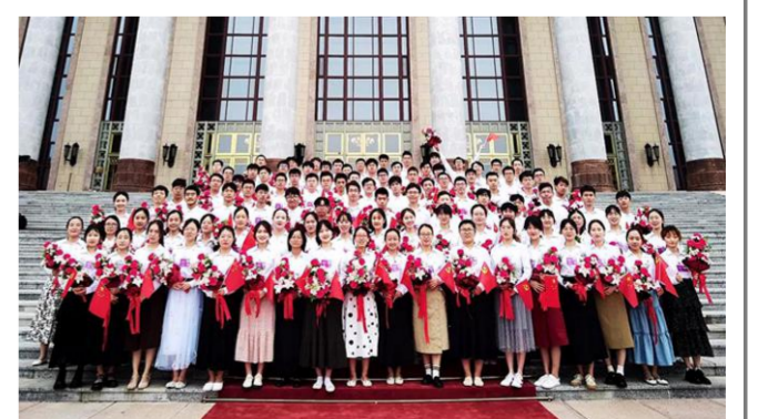
志愿服务,在国家重大活动任务中不断作出新的贡献。

2021年,在建党百年庆祝活动中,北理工数字与仿真技术实验室、爆炸科学与技术国家重点实验室提供了有力的科技保障。715名师生圆满完成大会合唱、大会献词、文艺演出合唱表演、志愿服务、大会方阵、欢迎方阵等多项任务。在北京冬奥会冲刺攻坚的关键时刻,北理工宇航学院、机电学院、机械与车辆学院、光电学院、自动化学院、计算机学院、管理与经济学院等多个学院的科研团队持续为北京冬奥会贡献科技力量。作为北京赛区唯一雪上项目场馆——首钢滑雪大跳台中心的志愿者主责高校,学校选派260名师生作为通用志愿者、技术专业志愿者、礼仪志愿者和城市志愿者,选派291名师生作为冬奥媒体转播项目实习生。北理工师生持续以高水平的科技供给,高效率的成果转化、高质量的