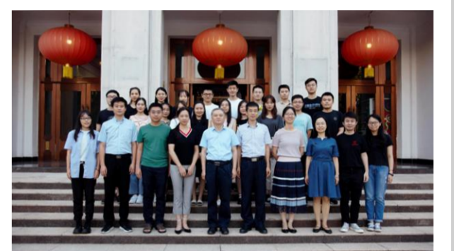
能源经济与环境管理北京市重点实验室

能源经济与环境管理北京市重点实验室以建设能源经济与环境管理战略智库为目标，以我国能源经济与环境管理问题为核心，紧密围绕经济社会发展中的重大战略需求和关键科学问题，开展相关理论和基础研究，为国家绿色发展和高质量发展提供决策支持，培养了一批能源经济与环境管理领域的高层次人才。实验室依托北京理工大学能源与环境政策研究中心建设，是北京市“新型智库领域”首批五家人选单位之一。