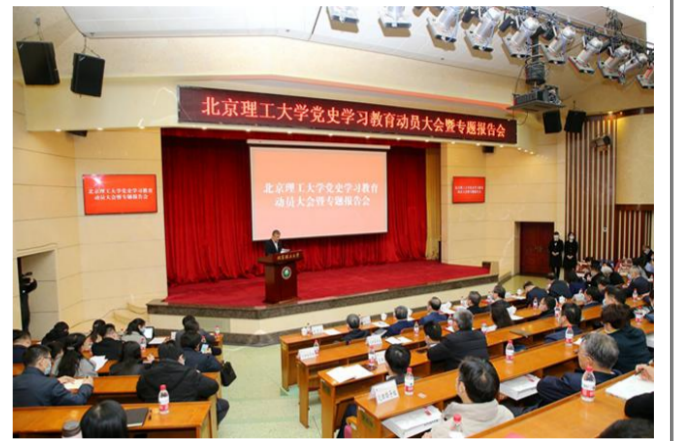
提升。组织师生员工接种新冠肺炎疫苗近10万人次,构建了疫情防控坚实屏障。

3月12日,北理工召开党史学习教育动员大会暨专题报告会。党史学习教育启动以来,北理工党委协同推进“学百年党史、知红色校史、育时代新人、干一流事业”四个板块重点工作,构建了“有理论、有故事、有榜样、有行动”的“四有”工作模式,打造了用红色基因铸魂育人的特色品牌,以“六个率先”的有力行动,带领全校党员干部师生学党史、悟思想、办实事、开新局。党史学习教育瞄准高标准高质量,获中央第二十指导组和教育部第一指导组充分肯定,受到主流媒体报道100余次,获上级简报刊载29次,着眼师生“急难愁盼”的现实问题和深层次体制机制问题,深入开展“我为群众办实事”实践活动。完成良乡校区文科教学楼组团装修改造工程,7个学院顺利入驻,良乡校区博士后公寓交付使用,前沿交叉科学研究院大楼、西山综合实验楼完工交付,师生校园生活品质得到不断